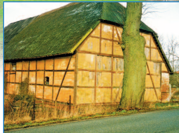
1978: Scheune im real existierenden Sozialismus