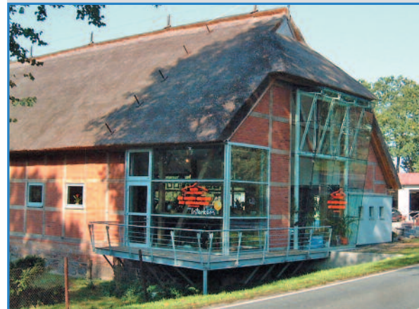
2008: Autoscheune Gerlach im florierenden Güstrow