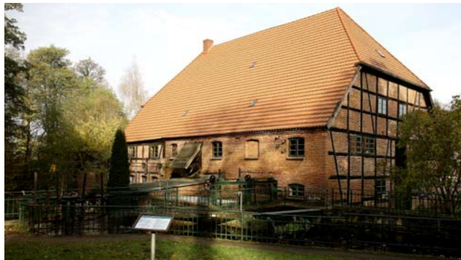
Diese alte, restaurierte Mühle wird heute noch vom Müller genutzt

erinnere mich noch genau bevor wir losgefahren sind. Sehr skeptisch standen sie den Vierrädern gegenüber. Mit viel Ehrfurcht näherte sich der ein oder andere den ATV's. Und jetzt, jetzt heizten sie über die abgeernteten Maisfelder als wenn sie mit diesen Fahrzeugen auf die Welt gekommen wären, Respekt! Am Horst angekommen, strahlen alle unter ihren Helmen hervor. Voller Begeisterung wurden die unendlichen persönlichen Eindrücke mit anderen Teilnehmern ausgetauscht. Völlig überzeugt von diesem Tag bedankte sich die gesamte Gruppe bei den Tourguides für diese unvergessliche Erfahrung. Manch einer hatte auch schon einen weiteren Termin vereinbart. Andere ebenfalls, aber zur Testfahrt, die in Richtung Kauf gehen soll. Eine Kundenbindungs- oder auch Gewinnungsmaßnahme, die Vertrauen schafft und erfolgsversprechend ist. □