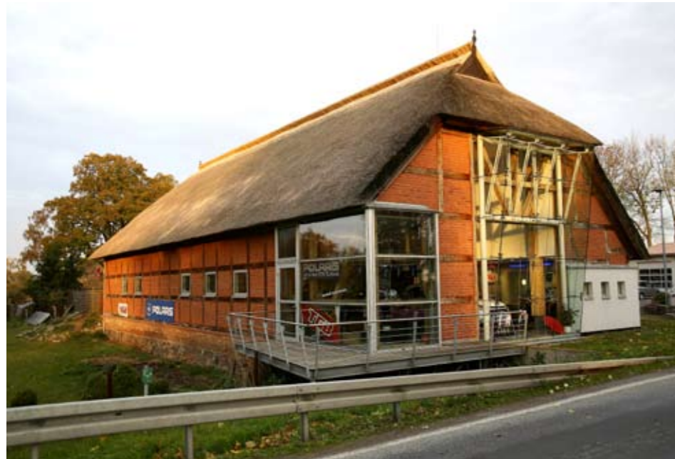
Von hier aus startete die Tour durchs Mecklenburger Hinterland. Die Autoscheune Gerlach in Güstrow

Der Tourguide und sein Kollege stimmten noch einmal die Kommunikationsanlage aufeinander ab und forderten die Truppe zum Aufsitzen auf. Wie an einer Perlenkette gereiht ging es los über die Straßen zum ersten Offroadkontakt. Schnell begannen die Teilnehmer die Kraft der Fahrzeuge auf dem losen Untergrund auszutesten. Manch einer hatte aber in Sachen Steuerung noch sichtliche Probleme. Dies wurde von den Tourguides direkt erkannt. Eine individuelle Sonderschulung behob diesen Mangel bereits nach wenigen Minuten. Nun konnte die Fahrt ziel-sicher weiter gehen. Wie auch schon zu >