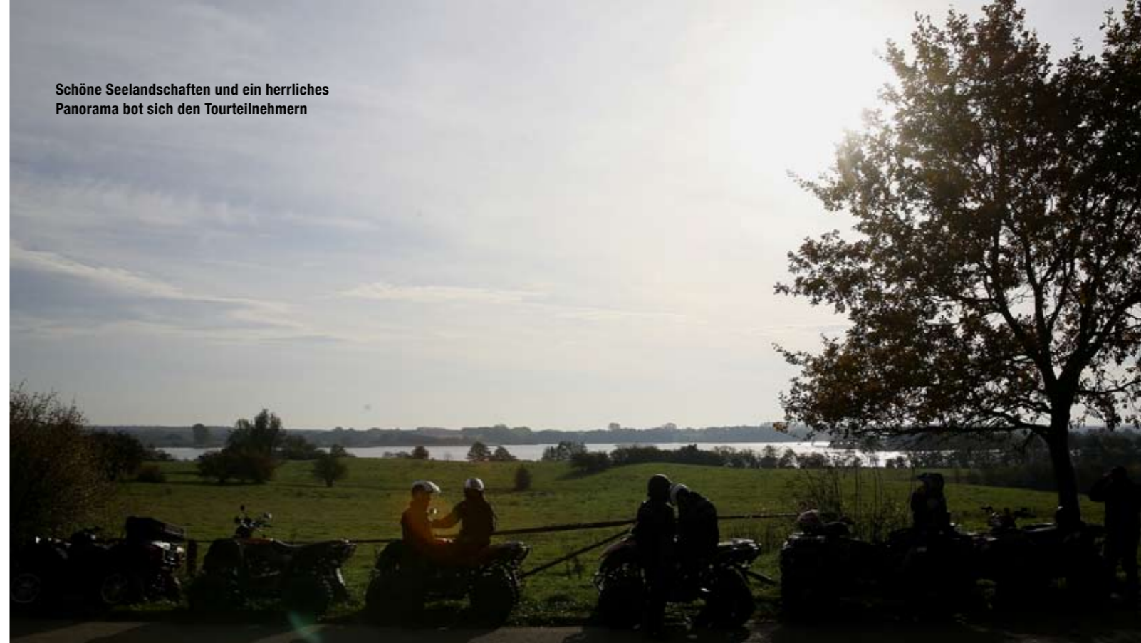
Schöne Seelandschaften und ein herrliches Panorama bot sich den Tourteilnehmern