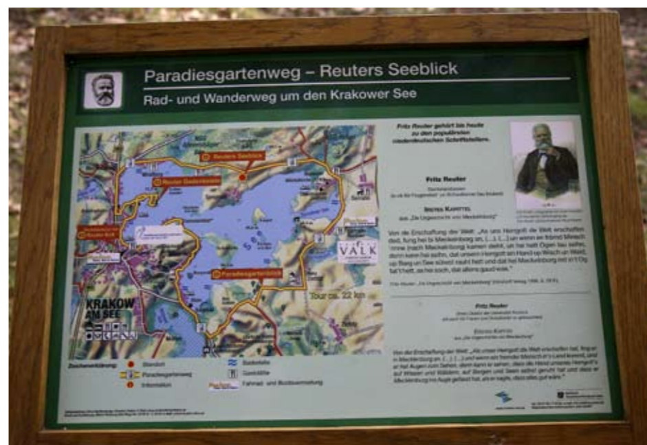
Ringherum der Seelandschaft gilt es die Natur zu erkunden