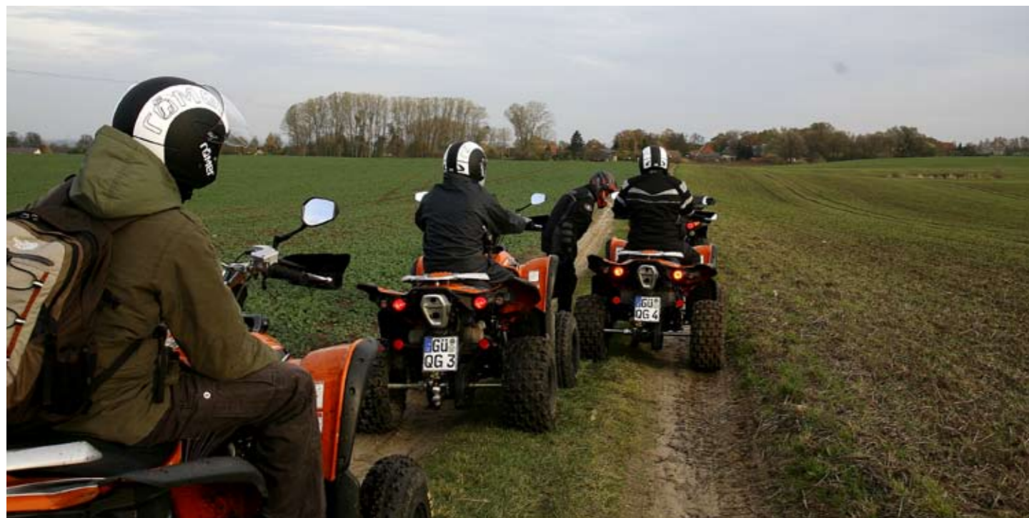
Kurze Einweisungen und Tipps helfen auch den Neulingen auf die richtige Fährte, so dass dem Vergnügen nichts mehr im Wege steht