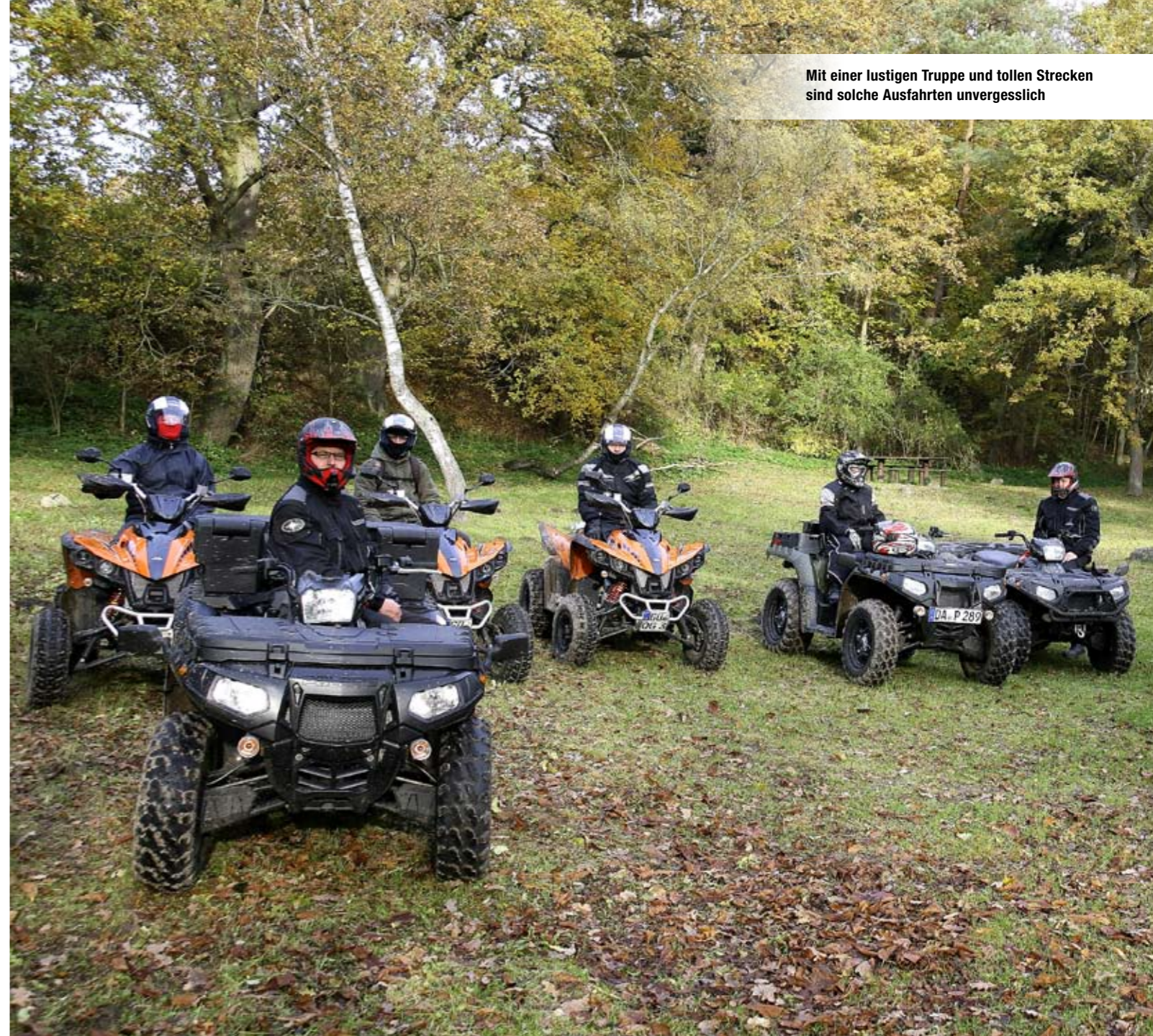
Mit einer lustigen Truppe und tollen Strecken sind solche Ausfahrten unvergesslich