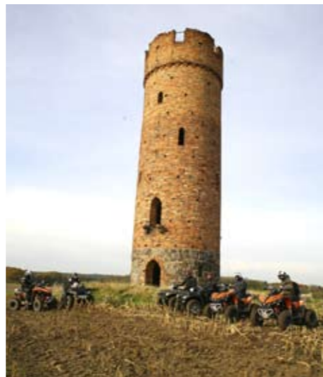
Alte Bauten kreuzten häufig unseren Weg