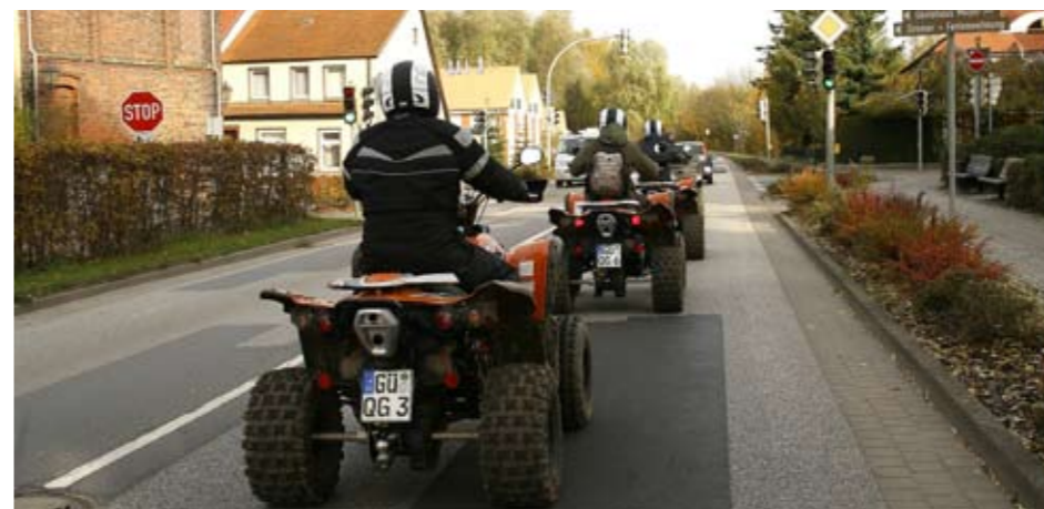
In der Gruppe zu fahren macht immernoch am meisten Spaß