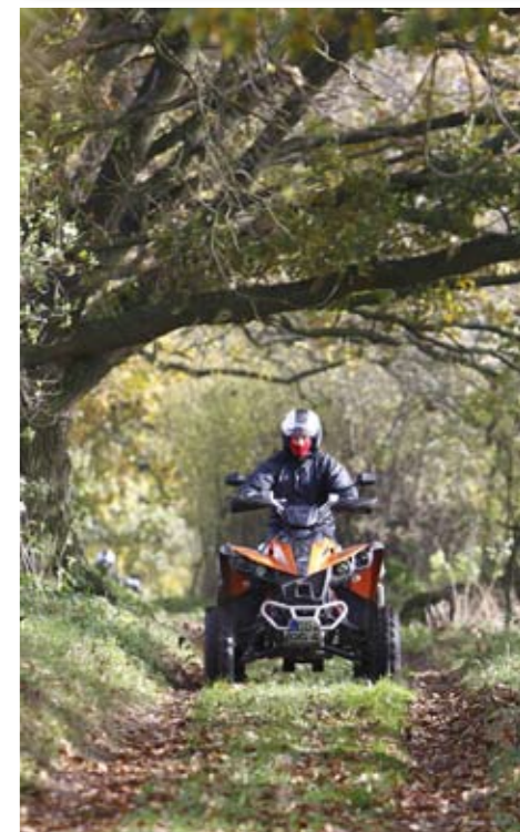
Durch saftiges Grün - sehr schöne Landschaft