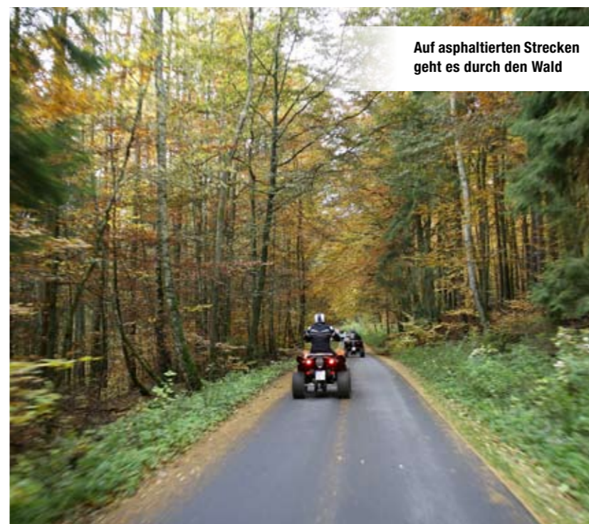
Auf asphaltierten Strecken geht es durch den Wald